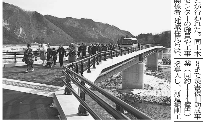
赤鹿橋の架け替え工事。新橋の供用開始を祝って、地域住民と渡り初め式が行われた。

県沿岸広域振興局土木部が主催する「赤鹿橋」の架け替え工事が完了し、24年度の事業として、小本川の河川改修を進めている。下流側の延長24.1メートルの赤鹿橋は、3番目に完成した橋梁。新たな赤鹿橋は、旧橋から150メートル下流側に架け替えられた。