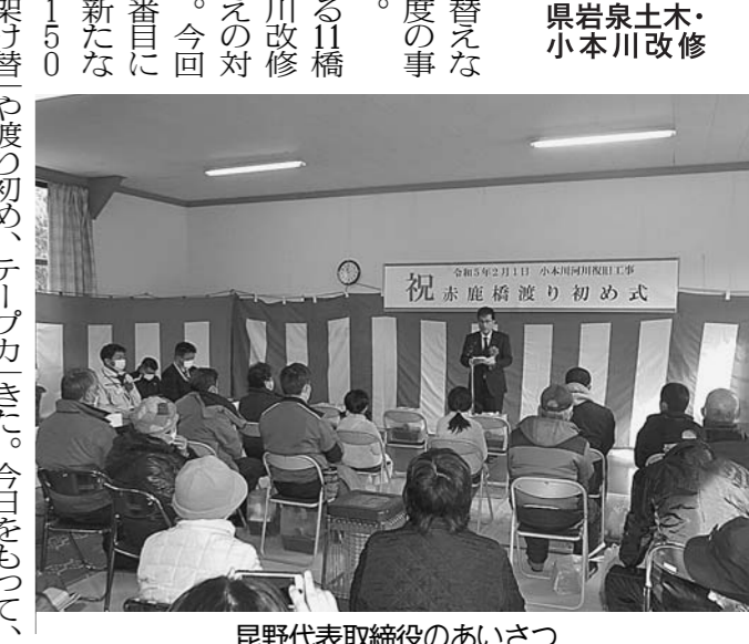
渡り初め式の様子。地域住民と渡り初め式が行われた。

新橋の橋長は約170メートルで、幅員は4メートル。橋梁の中央部には、車両の擦れ違いのため、延長20メートルにわたって幅員6メートルの待避所が設けられている。県北緑化・長沢産業㈱JVが橋梁下部工、北日本機械㈱が橋梁上部工の施工を担当した。新橋の整備事業費は約9億5千万円。