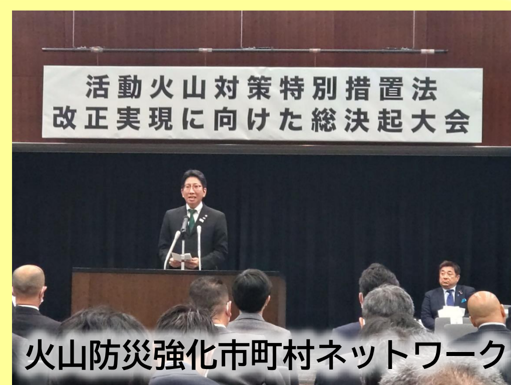
活動火山対策特別措置法改正実現に向けた総決起大会