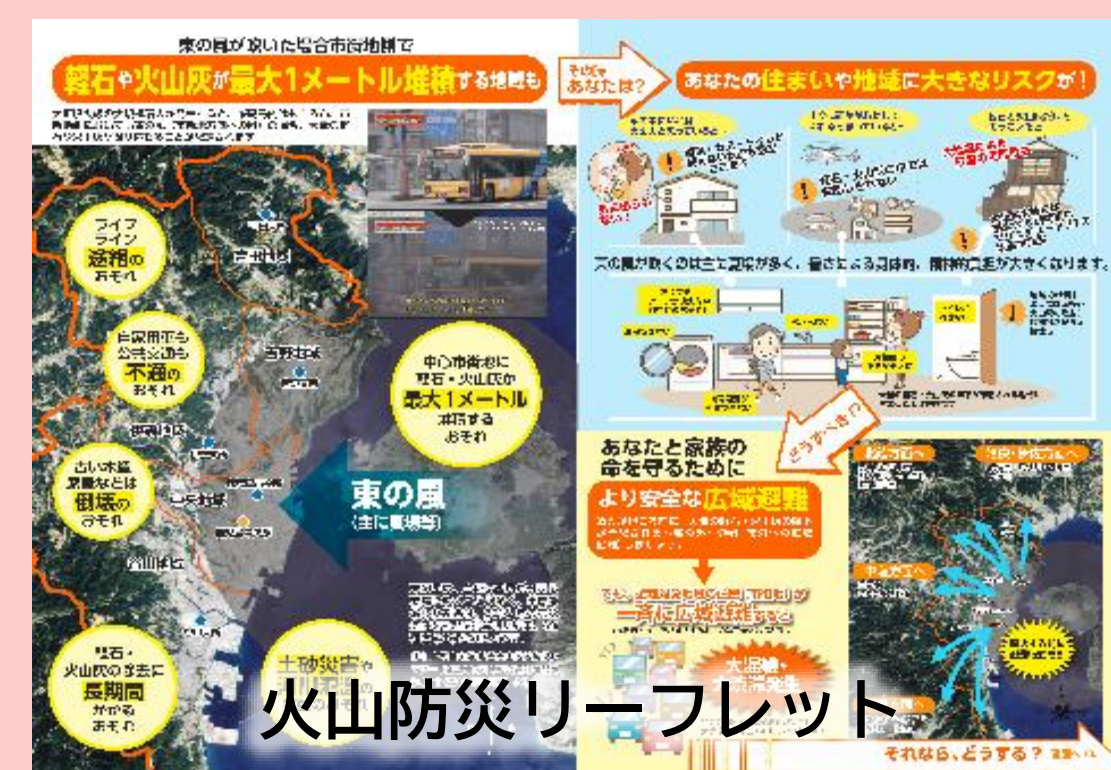
火山防災リーフレット