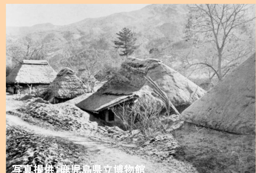
▲ 軽石火山灰に埋もれた家屋