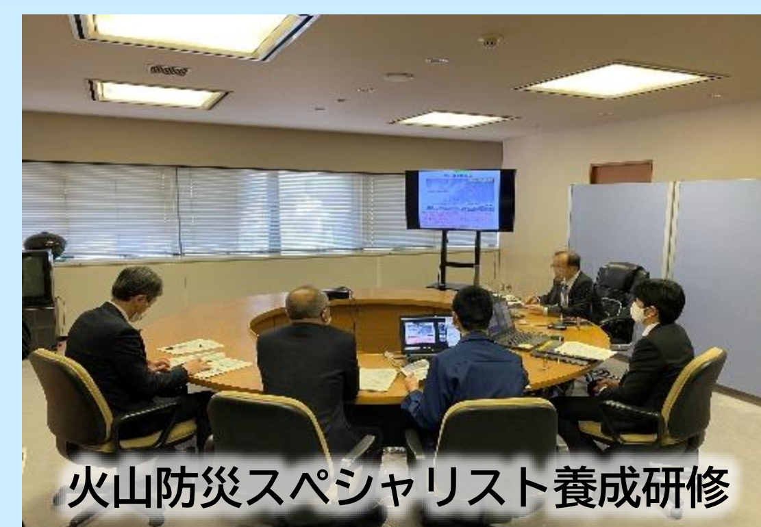
火山防災スペシャリスト養成研修