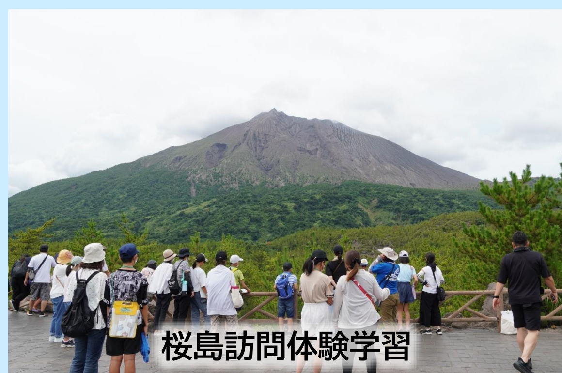
桜島訪問体験学習