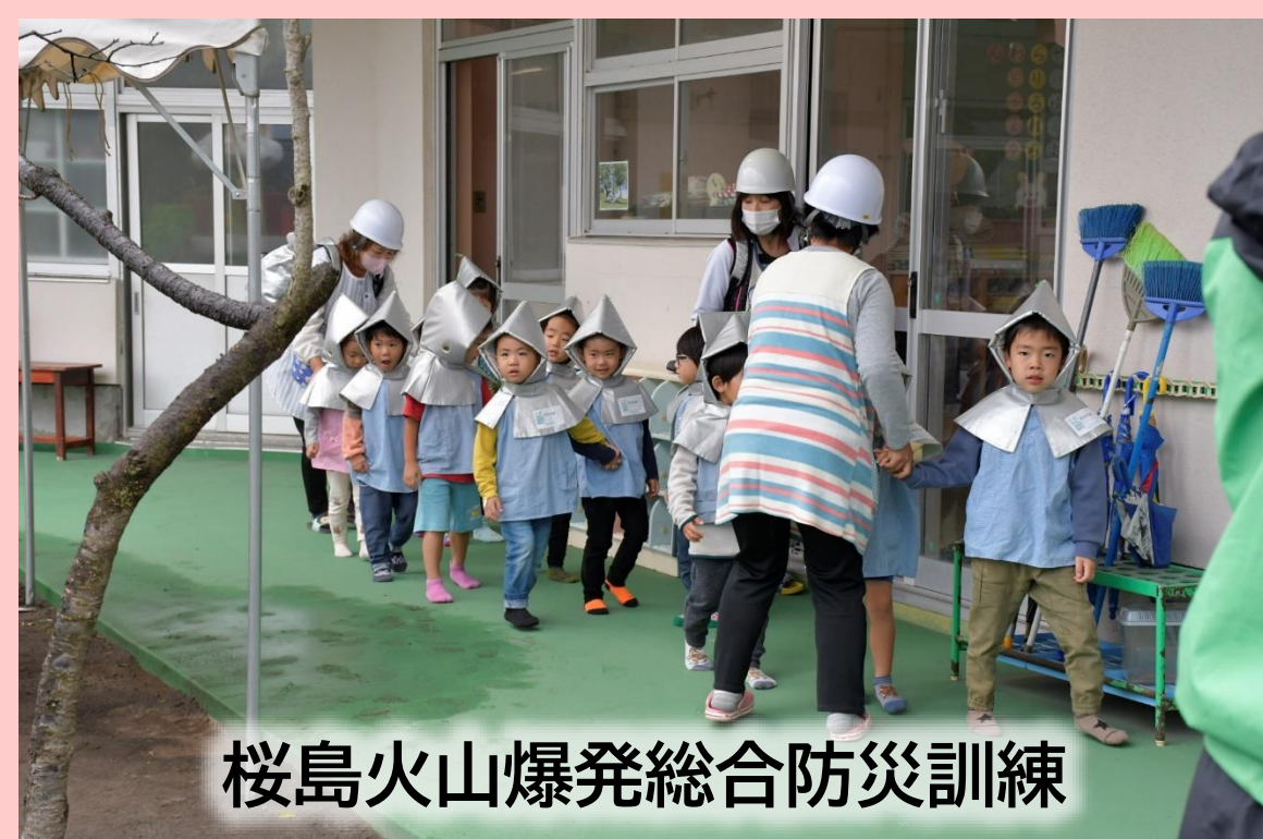
桜島火山爆発総合防災訓練