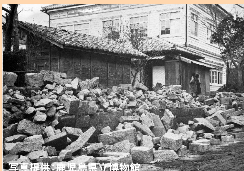
▲ 地震による市街地側の被害