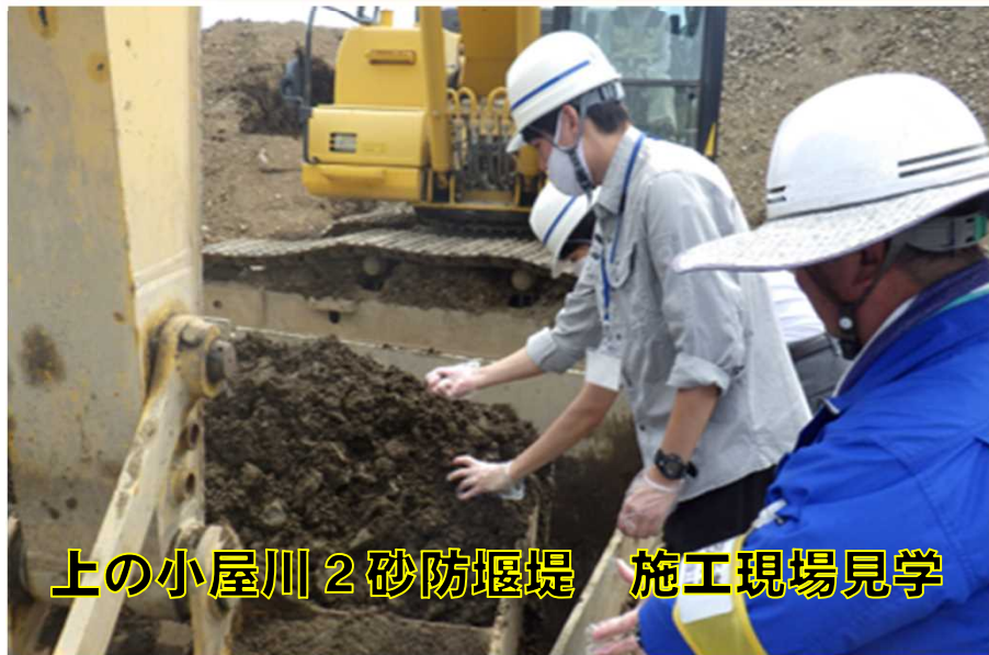
上の小屋川 2 砂防堰堤 施工現場見学