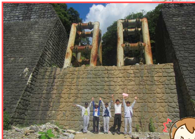
大迫力の堰堤を間近に見れる!