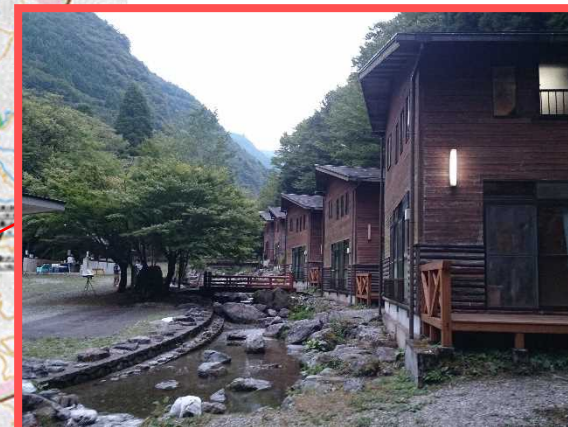
★満点の星空を眺めに行こう!★