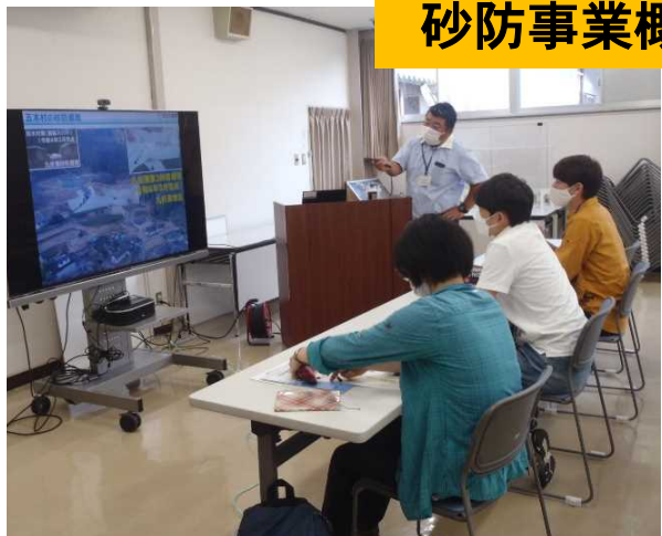
砂防事業概要の説明