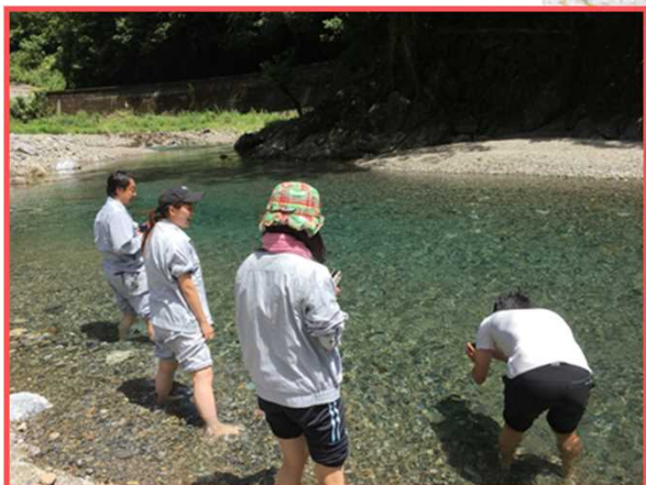
17年連続水質日本一の清流川辺川