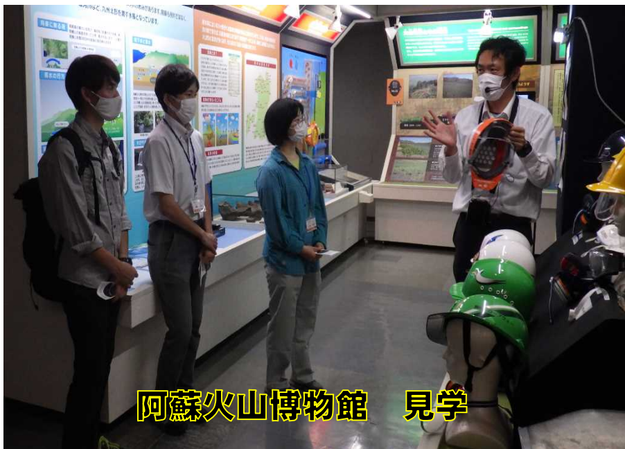
阿蘇火山博物館 見学