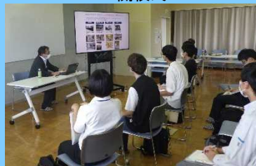
地域交流の取り組み紹介