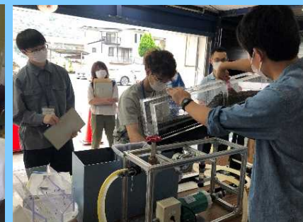
土石流模型実験実習