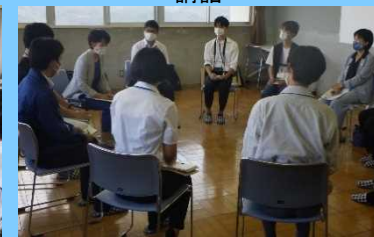
行政関係者との意見交換