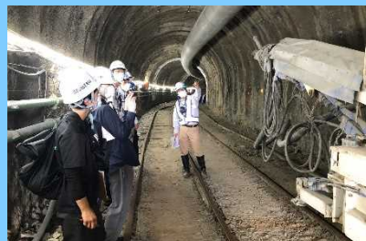
排水トンネル工事現場の見学