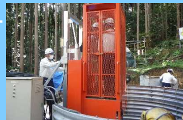
集水井内部の見学