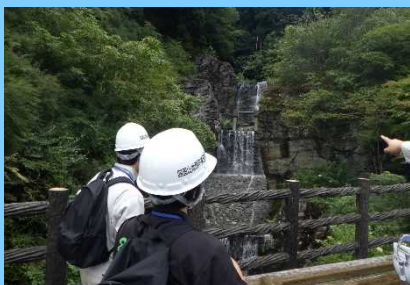
景観に配慮した砂防堰堤の見学