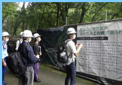
溪流保全工事現場の見学