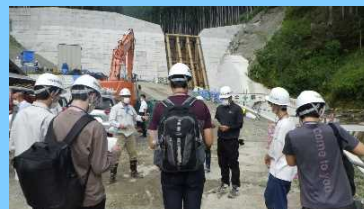
砂防堰堤工事現場見学