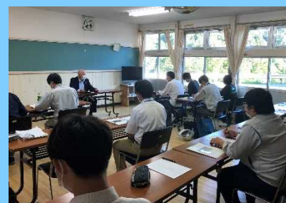
行政関係者との意見交換