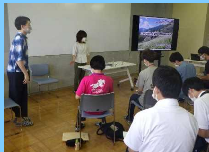
ジオパークの取り組み紹介