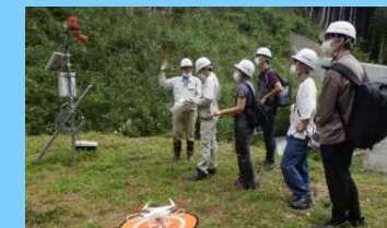
ドローン操作体験