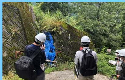
地すべり地区の被害状況調査