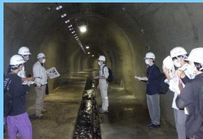
排水トンネル内部の見学