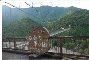
谷瀬のつり橋 (奈良県十津川村)