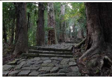
熊野古道 (和歌山県那智勝浦町)