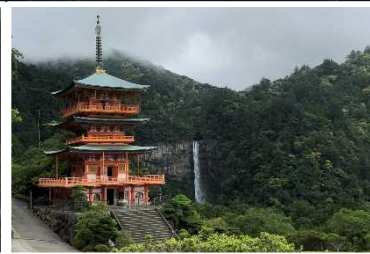
熊野那智大社 (和歌山県那智勝浦町)