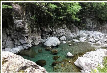
みたらい溪谷 (奈良県天川村)