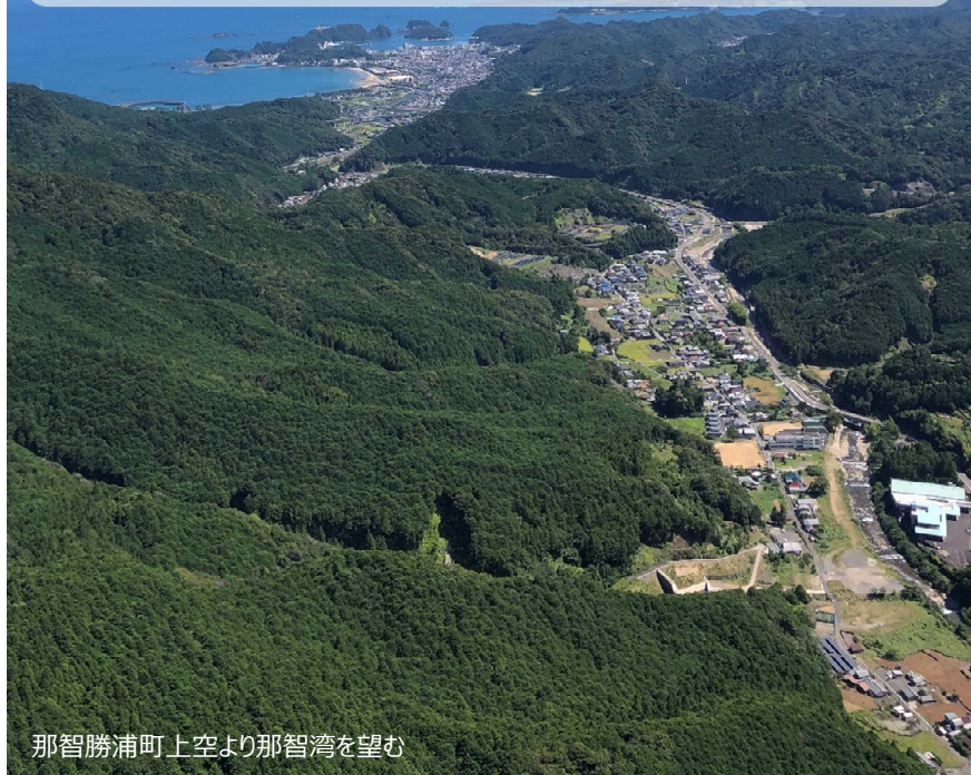
那智勝浦町上空より那智湾を望む