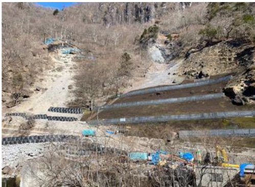
馬返山腹工(施工中)