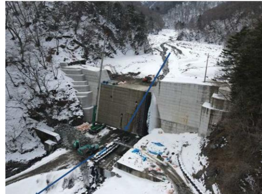
大事沢砂防堰堤(施工中)

山間部における災害時孤立化防止のため、土砂流出の激しい大事沢で砂防堰堤を整備しています。