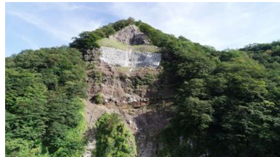
稲荷川上流山腹工(施工中)

世界遺産「日光の社寺」を挟むように流下している大谷川、稲荷川の上流において土砂発生源となっている崩壊地に対策工を整備しています。