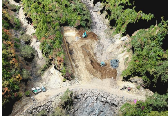
大真名子東沢砂防堰堤(施工中)

日光市街地と世界遺産「日光の社寺」を土砂災害から守るため、砂防堰堤を整備しています。