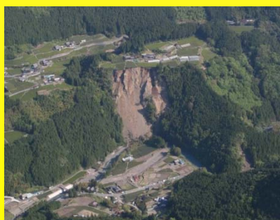
浜松市天竜区で発生した地すべり (平成25年4月)