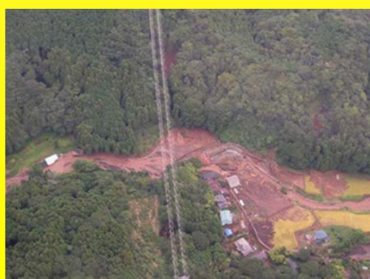
小山町で発生した土石流による被害状況 (平成22年9月)