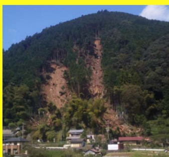
静岡市葵区で発生したがけ崩れ (平成23年9月)