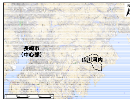
図-1 山川河内地区の位置図

本研究で対象とする山川河内地区の位置を図-1に示す。山川河内は3方を山に囲まれ、南は橘湾天草灘を望み、中央に山川河内川が流れ、古くから35世帯前後を維持してきた農村集落である。長崎市街地に近いことに着目した地域のリーダーが電照菊等の花卉の栽培を始めた。昭和40年代には専業の花農家が増え、花卉の栽培は地区に活況をもたらし、花の里と呼ばれるようになった。長崎豪雨災害の頃は地区が最も繁栄したときで、住宅の建替えは終了していた。近年になると燃料の高騰等による花卉栽培の不振、勤め人世帯の増加、高齢化・少子化が進んでいる。昭和57年には世帯数35、人口173人、全世帯農家であったが、平成24年現在では32世帯、126人と減少している。専業農家13世帯、サラリーマン15世帯、自営業2世帯、無職(年金生活)2世帯と職業構成も多様化している。なお、地区は、長崎市茂木町にある玉台寺(浄土宗)の檀家である。この地区では多くの祭礼・祭祠が、自治会行事として現在でも続いている。地区内に観音像、地藏像、水神、土神、山神等が祭られ、大切にされている。