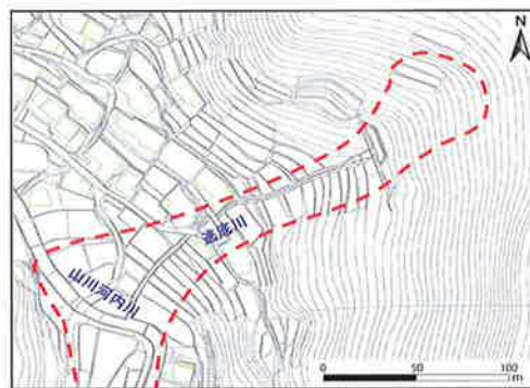
図-2 逃底川流域の崩壊推定図