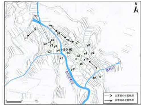
図-3 長崎豪雨災害時の避難状況

道路も冠水して動けなかったもので、孤立した消防団員 5、6 人は右岸の民家(s3)の庭から車のライトを照らして、左岸側の民家(Y5、S4)の前の護岸が削られる様子を見ていた(写真-3)。20 時頃に 2 回普段嗅いだことがない樟脳のような異臭を感じ、「上流で土砂崩壊が発生した」と直感したが、路面