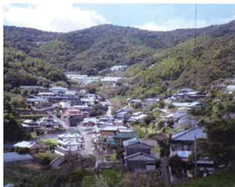
写真-1 山川河内地区の全景

れ、南は橘湾天草灘を望み、中央に山川河内川が流れ、古くから35世帯前後を維持してきた農村集落である(写真-1)。長崎市街地に近いことに着目した地域のリーダーが電照菊等の花卉の栽培を始めた。昭和40年代には専業の花農家が増え、花卉の栽培は地区に活況をもたらし、花の里と呼ばれるようになった。長崎豪雨災害の頃は地区が最も繁栄したときで、住宅の建替えは終了していた。