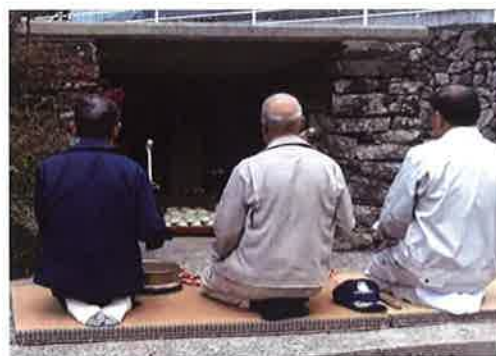
写真-2 馬頭観音の前での鉦はり

た人馬とも祭られているとも考えられる。当時は、牛馬は農作業を担うとともに長崎まで売り荷運搬をした大切な家畜で、家族同然であったのではないかというコメントも寄せられている。