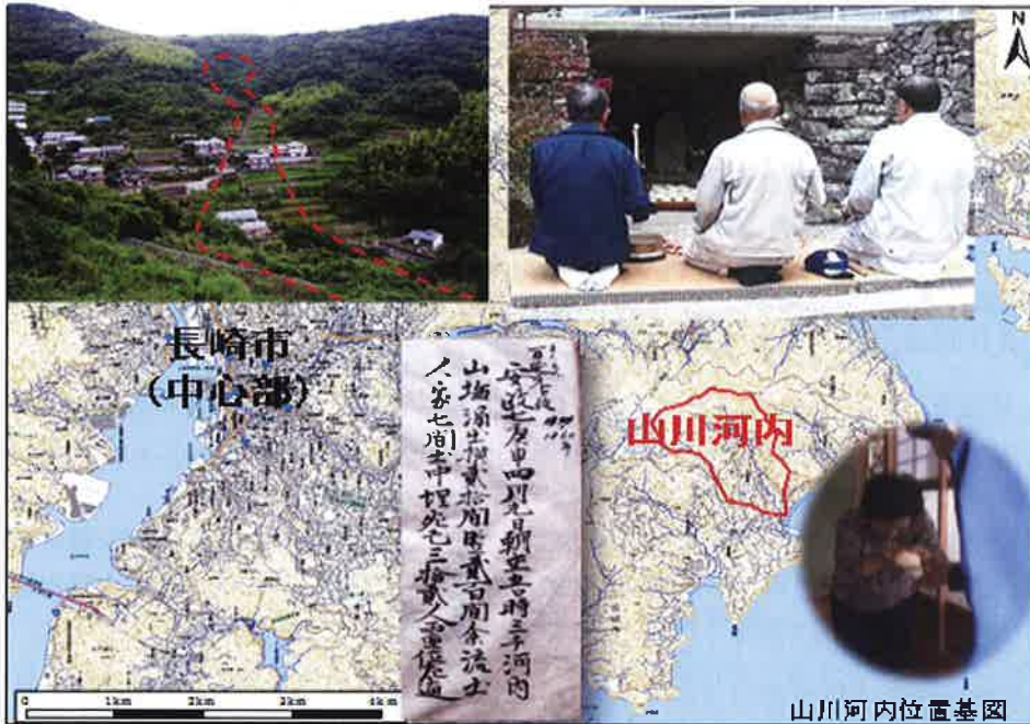
長崎市山川河内地区の念仏講まんじゅう配り—153年前の土砂災害の伝承がつなぐ防災—