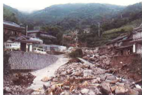
写真-3 護岸が流された左岸側の住宅 (下流から)

冠水と電話の不通で消防団員は集落にこの情報を伝えることは出来なかった。危険を感じた家では各自で安全を確保せざるを得なかった。山川河内川の上流部の左岸では、河川の氾濫、土石流の発生に気がついたようで、最上流の家(Y5)が隣の家(S4)へ先ず避難し、その家が危険になるともう一つ下流の家(Y6)に 2 世帯が避難した。この家も裏山等から水が入ってきたすと、3 世帯ともその地域で一番高い尾根筋の家(y7)に避難した。右岸川の家(S1)も高台の家(h1)に避難した。逃底川でも、万延元年の土石流で小屋が被害を受けた家(T)が同じ被害を受け、右岸側の高台の家(y10)に避難した。