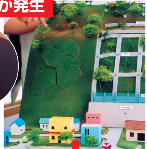
リリース (模型背面)

①模型背面のリリースを持ち、ピンを押込んでから指を離す。 (地面(土塊)が崩れ落ち、がけ下の家屋に被害が出る。)