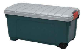
専用コンテナボックス付 （色は選べません）

レンタル 地域によって送料が異なりますので 事前にお問い合わせください。 （別途保険料がかかります）