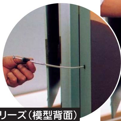
リリース(模型背面)