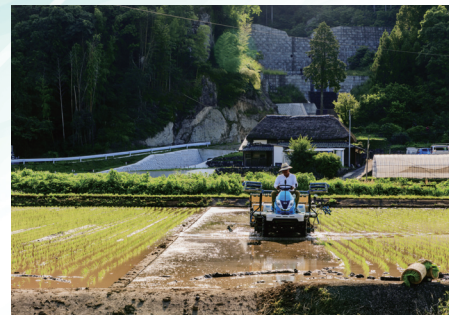
「早苗の頃」 藤松政晴 ●撮影場所/佐賀県豊島市 ●第4回砂防カレンダー写真コンテスト 佳作

佐賀県南部の豊島市は多良島と有明海の自然の恵みによって古くはれた伝統ある城下町です。高橋山物(佐賀産)や有明海の自然を生かしたイベント「ヨロリンピック」などが有名です。土砂災害防止は、多良島山系を水源とする二級河川豊島川水系中川の支川に建設された砂防堰堤です。流域で山の荒廃や沿岸浸食が進み、浸床に不安定な土砂が堆積していたため、土石流から下流の人家、市道等を保全するために建設され、平成29年度に完成しました。