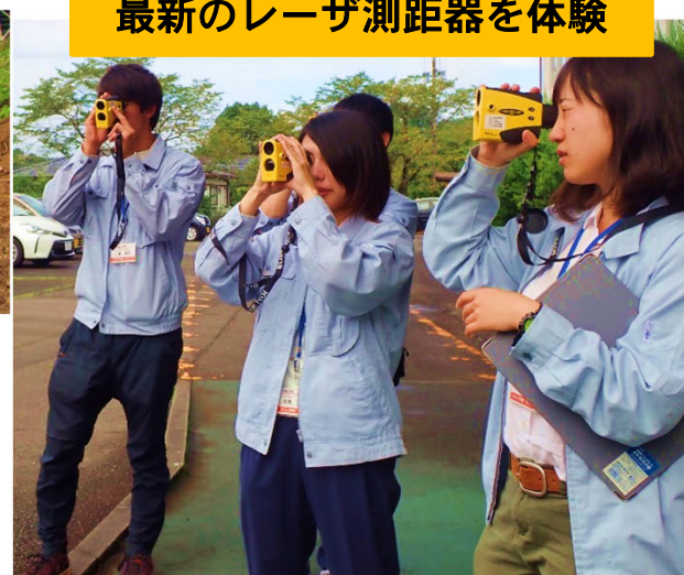
最新のレーザ測距器を体験