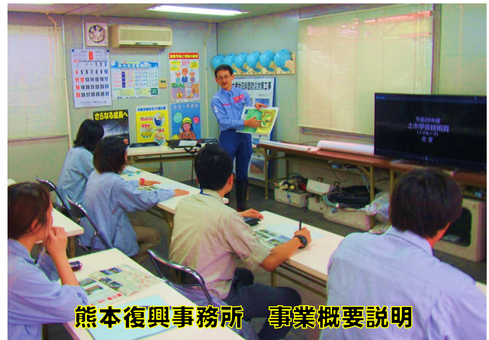
熊本復興事務所 事業概要説明