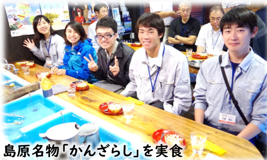
島原名物「かんざらし」を実食