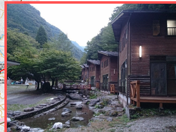
★満点の星空を眺めに行こう!★