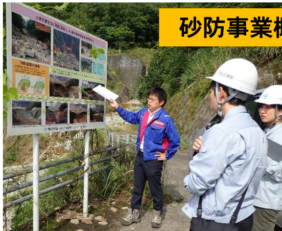
砂防事業概要の説明