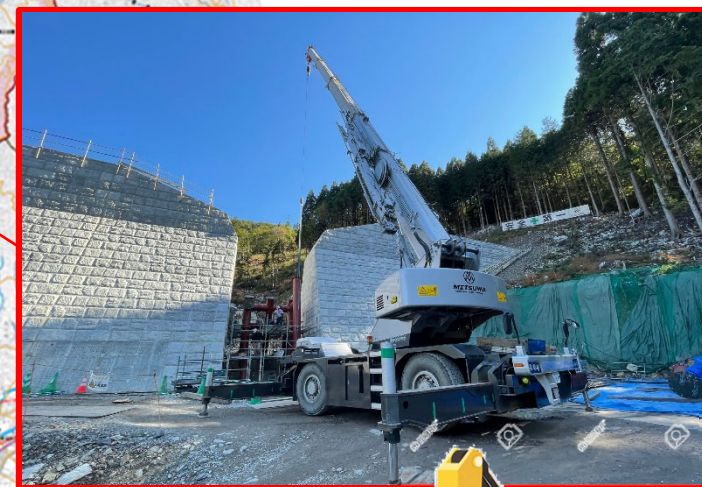
砂防の現場を見に行こう