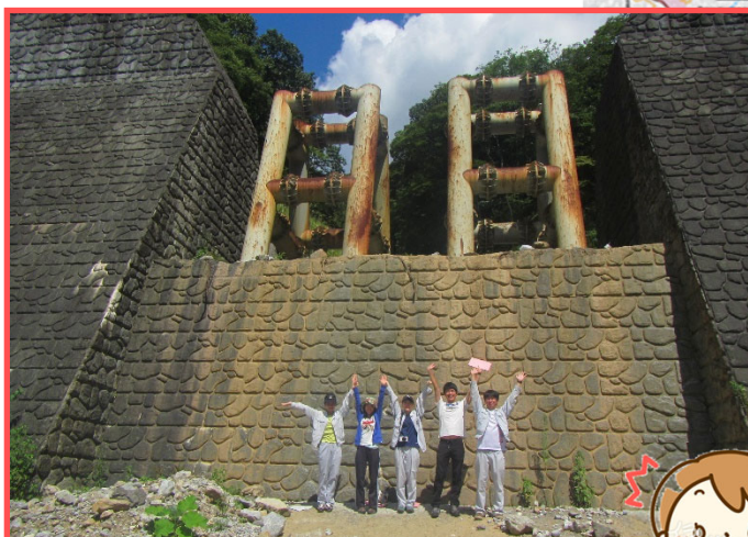
大迫力の堰堤を間近に見れる!