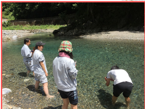
15年連続水質日本一の清流川辺川