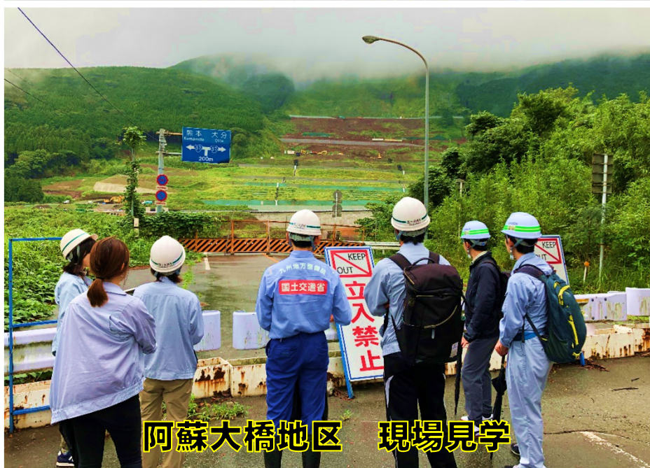
阿蘇大橋地区 現場見学

令和3年度からは、事務所名が「熊本復興事務所」 から「阿蘇砂防事務所」に変わります