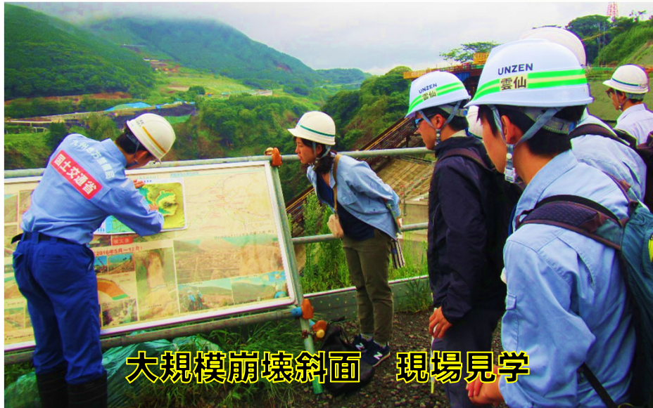
大規模崩壊斜面 現場見学