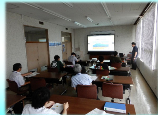
新燃岳噴火を振り返る