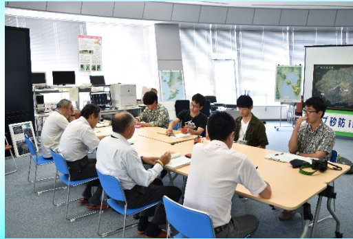
事務所長を交えての意見交換会