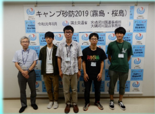
開 講 式