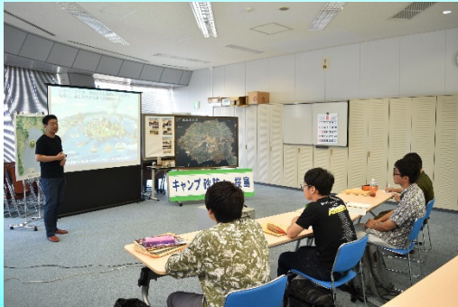
桜島ミュージアムの取り組み