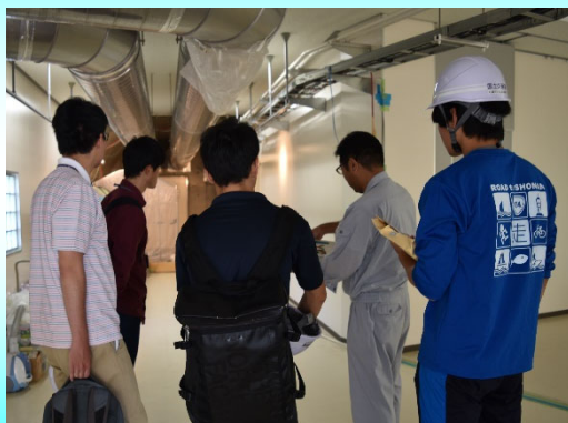
有村川観測坑道見学