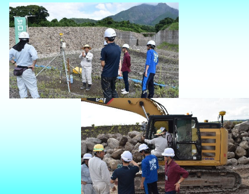
砂防工事現場体験