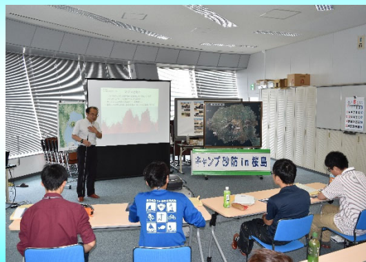
桜島の火山活動状況