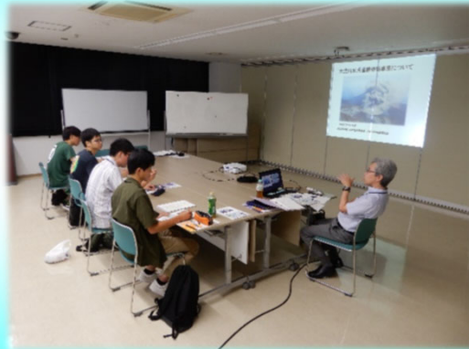
霧島砂防の事業概要