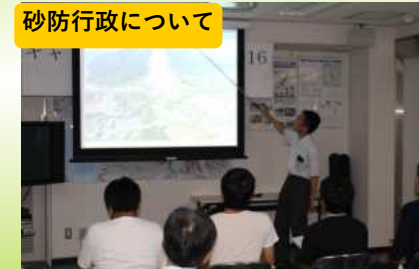
事務所長による講義