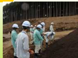
実際に使用されている材料に触れる