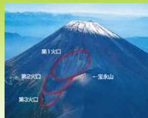
山頂火口より大きい宝永火口