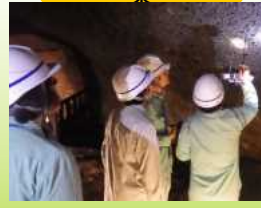
青木ヶ原樹海を調査