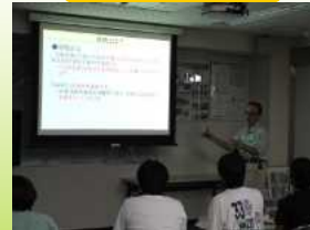
砂防について学ぶ