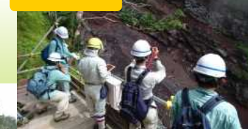
標高約2,100mの工事現場を見学