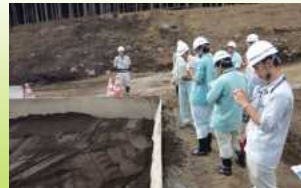
砂防の工事現場を見学