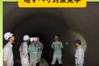
排水トンネルなどを見学