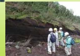
道中には険しい箇所も