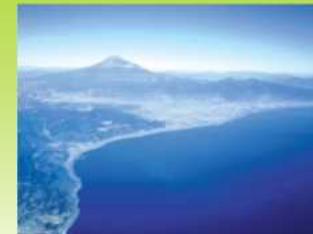
サッタ峠上空より富士山を望む