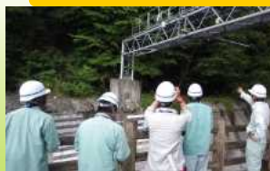
土石流観測施設を見学