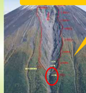
源頭部対策工事現場