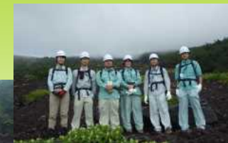
御中道にて記念撮影