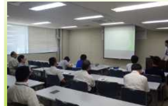
キャンプ砂防の成果をレポートにとりまとめ発表