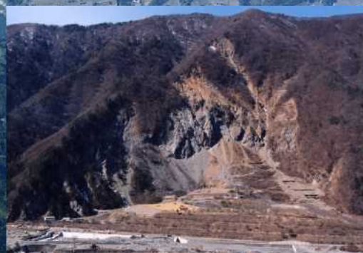
昭和36年豪雨により崩落した大西山