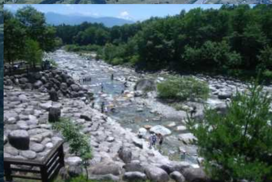
水辺空間の利用や景観を考慮した太田切床固工群

○ドローンなどのUAVやICT技術など、現場で導入されている最新技術を学ぶことできた。