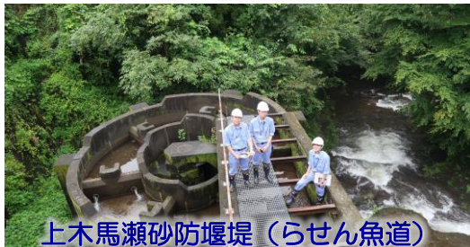
上木馬瀬砂防堰堤（らせん魚道）