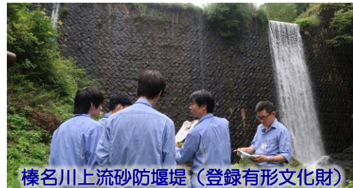
榛名川上流砂防堰堤（登録有形文化財）