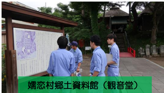
婦恋村郷土資料館（観音堂）