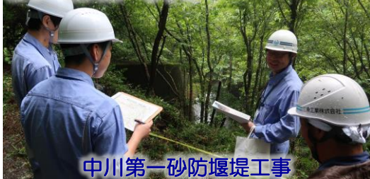
中川第一砂防堰堤工事