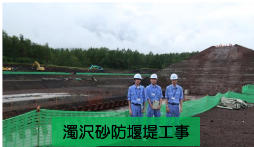
濁沢砂防堰堤工事