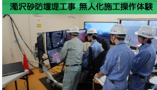
濁沢砂防堰堤工事 無人化施工操作体験