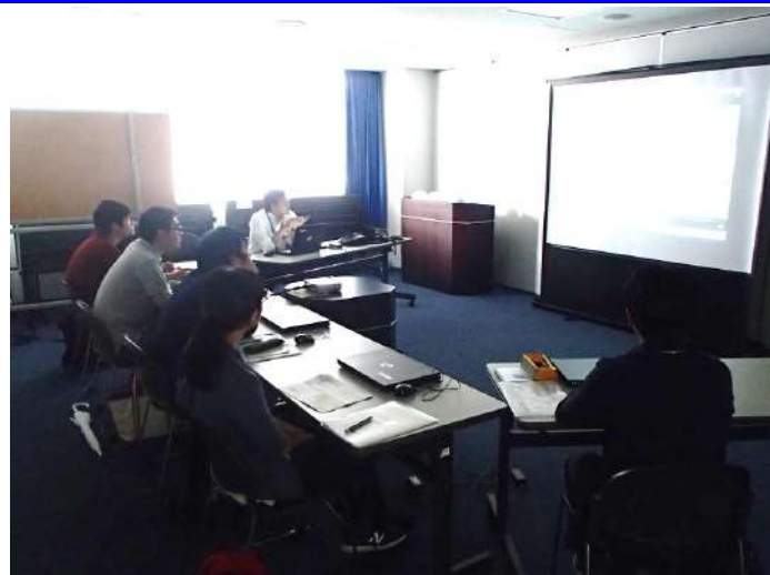
太田川河川事務所の取組 (広島西部山系直轄砂防事業・小規模砂防堰堤について)