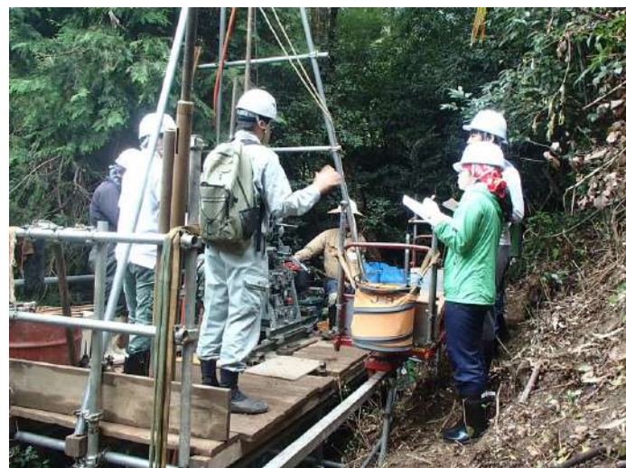
現地視察(倉重地区) 地質調査作業見学