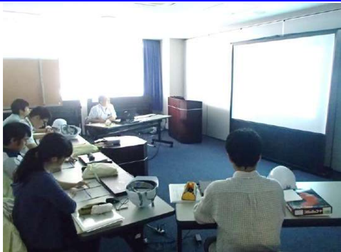
砂防堰堤設計計画(座学) —設計の流れについて—