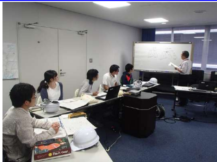
砂防堰堤設計計画(座学) —運搬可能土砂量の計算問題—