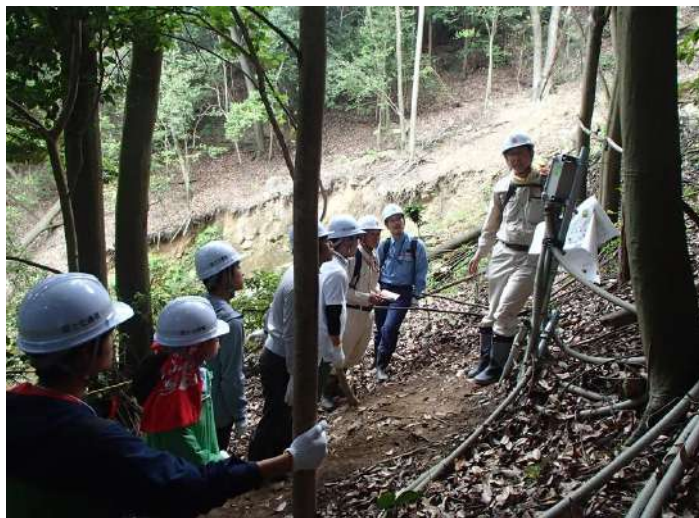
現地視察(八木地区) 斜面観測業務見学