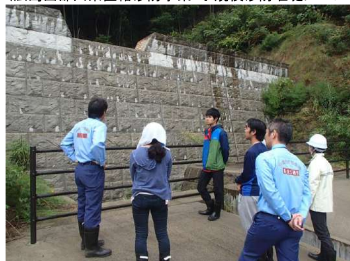
現場視察(大町地区) —小規模溪流対応型砂防堰堤—