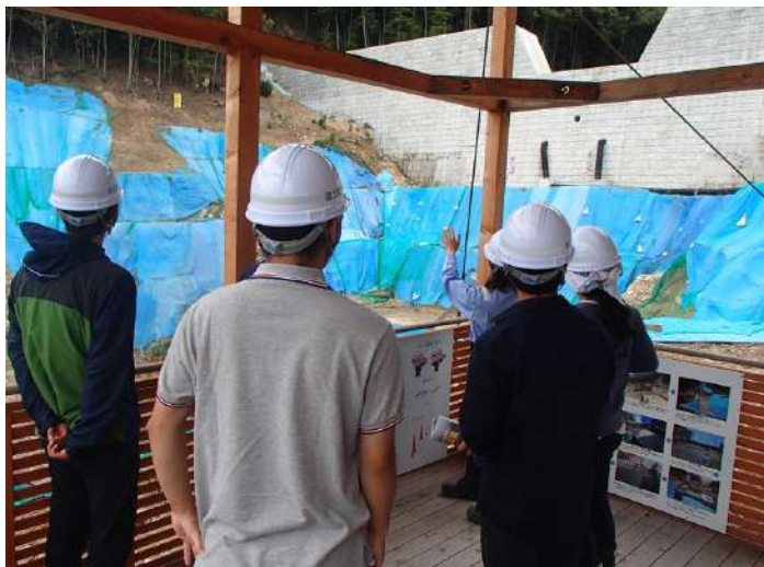
現場視察(八木地区) —8. 20広島土砂災害復旧現場—