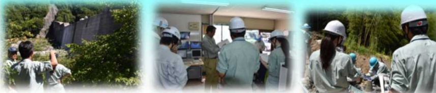
滑川第1砂防堰堤 桜洞砂防堰堤(プラント生コン生成) 桜洞砂防堰堤(生コン受入検査)

(AM) 滑川第1砂防堰堤・桜洞砂防堰堤(コンクリート打設) (PM) 越百川第3砂防堰堤・下洞沢砂防堰堤(測量)