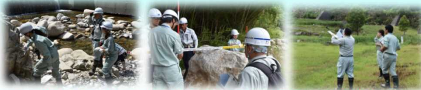
牛ヶ瀬砂防堰堤(岩判定) 中津川第2砂防堰堤(礫径調査) 四ツ目川遊砂工

(AM) 牛ヶ瀬砂防堰堤(岩判定)・中津川第2砂防堰堤(巨石の礫径調査)・ 四ツ目川遊砂工・苗木城址 (PM) 南木曾町博物館(講話)・梨子沢土石流災害復旧関連施設