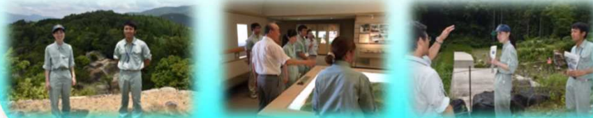
苗木城址 南木曾町博物館 梨子沢災害復旧