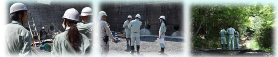
草口第1砂防堰堤 方月第1砂防堰堤 虎溪山山腹工