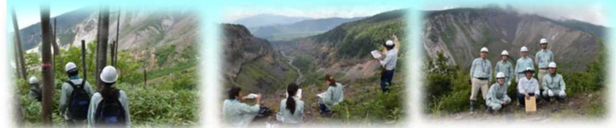
御嶽山西部地震崩壊地現地調査 伝上崩れの前にて