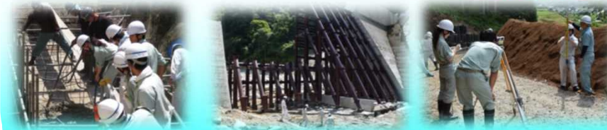
桜洞砂防堰堤(生コン打設) 越百川第3砂防堰堤 下洞沢砂防堰堤(測量)