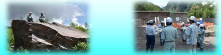
土石流によって押し上げられた巨石の上にて 濁沢川治山ダム工事現場