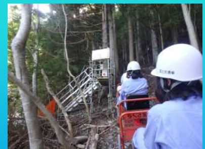
工事現場見学（夜子沢砂防堰堤）