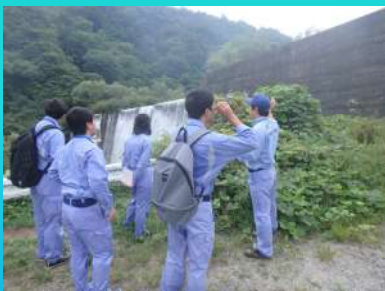
現地調査（大武川砂防堰堤）