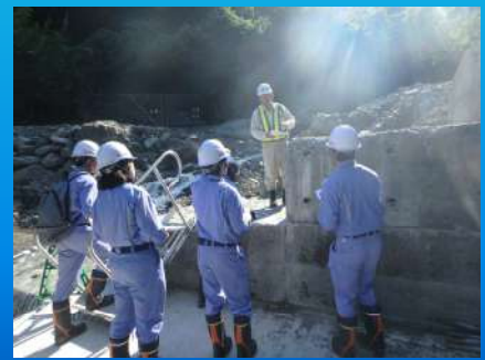
工事現場見学（夜子沢砂防堰堤）