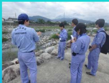
現地調査（大武川床固群）