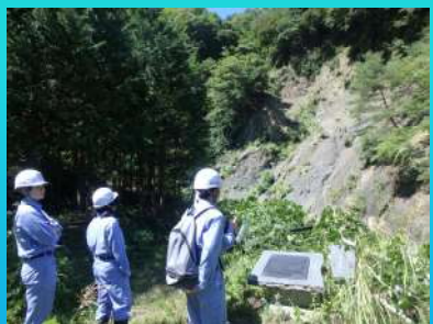
現地調査（新倉断層）