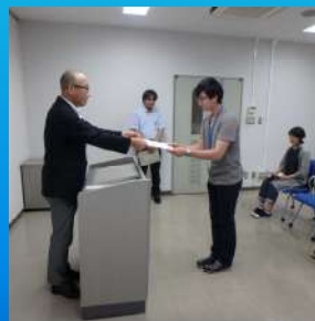
閉校式（修了証授与）