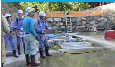
工事現場体験（ウォータージェット体験）