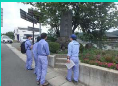
現地調査（治水興郷の碑）