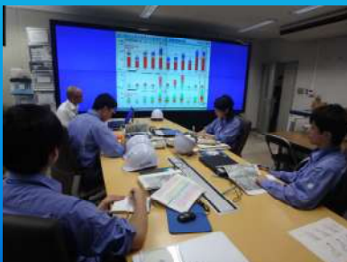
講義（頻発する土砂災害について）