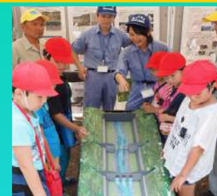
地元小学生に土石流模型の説明②