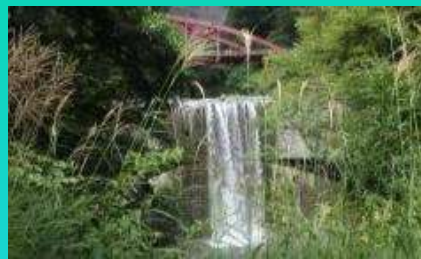
現地調査（芦安堰堤）