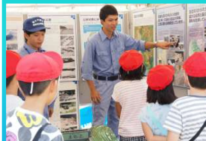
地元小学生にパネル説明