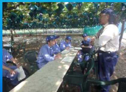
地域の文化・産業との関わりについて （日川水制）