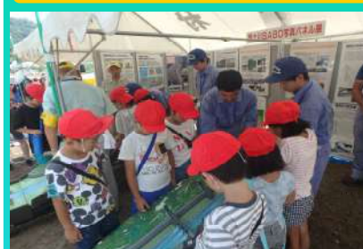
地元小学生に土石流模型の説明①