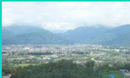
現地調査（甲府盆地を一望）