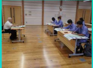
早川町長（代理：振興課長）の講座（早川町役場にて）