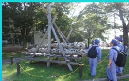
現地調査（信玄堤及び聖牛）