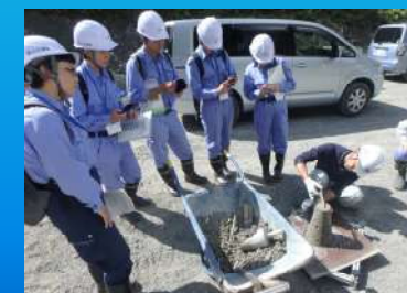
工事現場体験（スランプ試験体験）