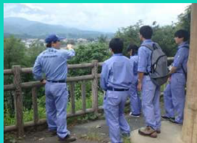
現地調査（釜無川・大武川合流点）