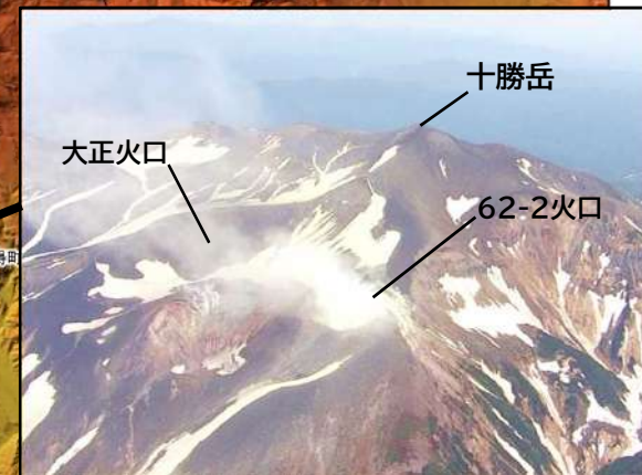
十勝岳 大正火口 62-2火口