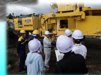
砂防工事現場体験