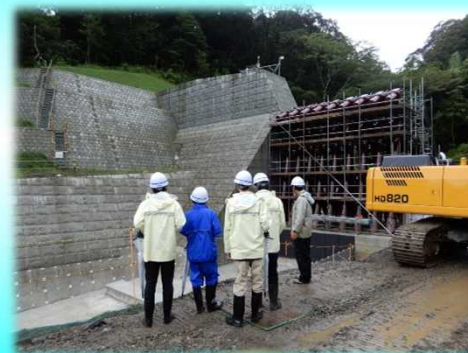
講義:砂防工事現場体験