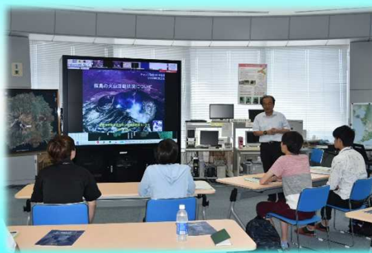
桜島の火山活動状況