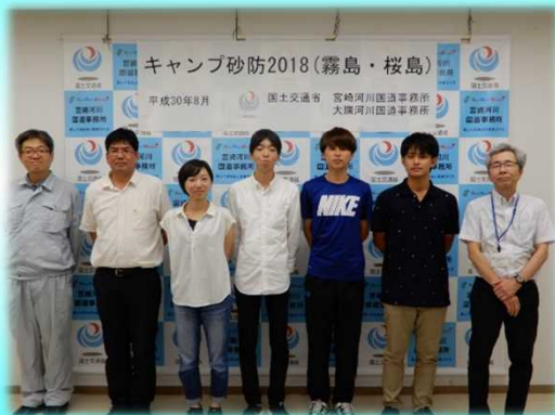
開 講 式