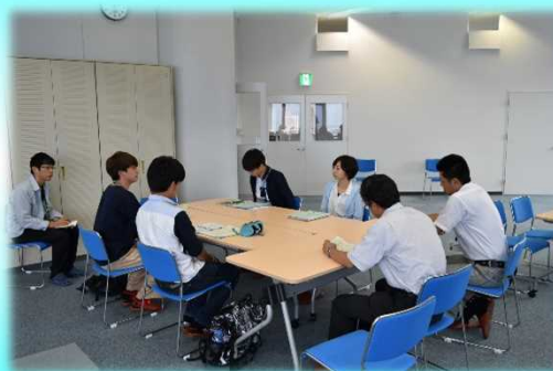
事務所長を交えての意見交換会