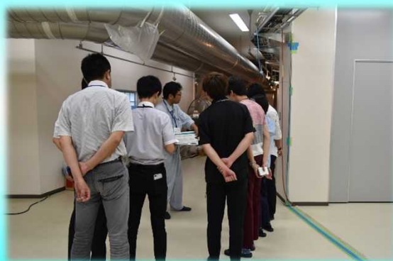
有村川観測坑道見学