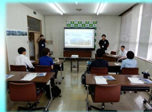
新燃岳噴火を振り返る