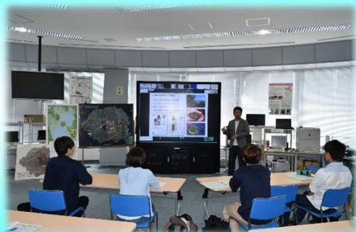
桜島ミュージアムの取り組み