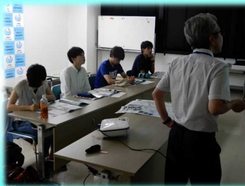
霧島砂防の事業概要