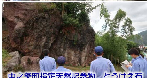
中之条町指定天然記念物 とうけえ石