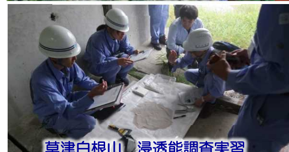
草津白根山 浸透能調査実習