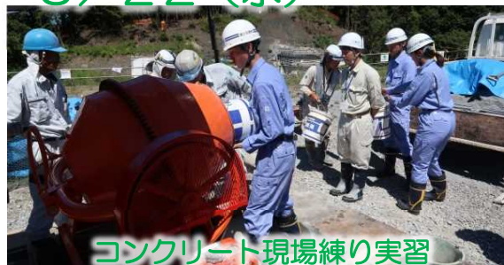
コンクリート現場練り実習