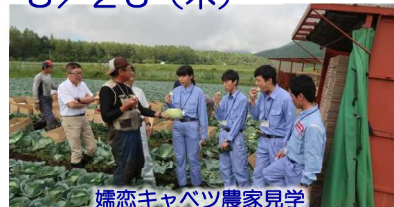
孺恋キャベツ農家見学