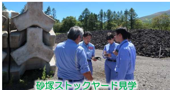
砂塚ストックヤード見学