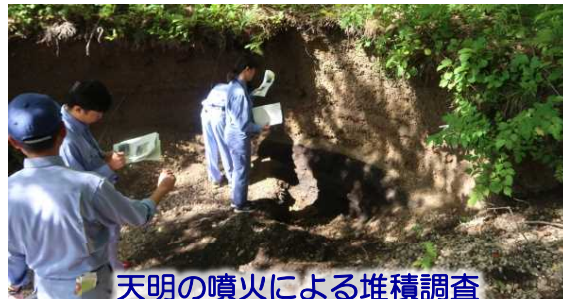
天明の噴火による堆積調査