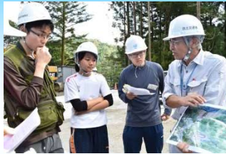
地すべり対策工見学