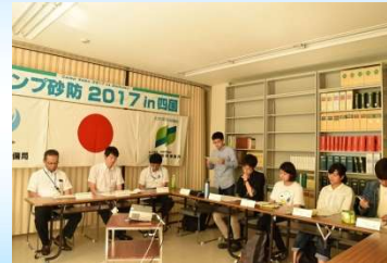
事務所職員との意見交換