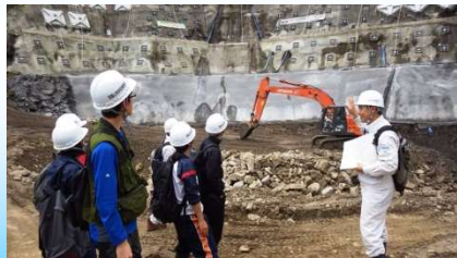
災害復旧工事見学