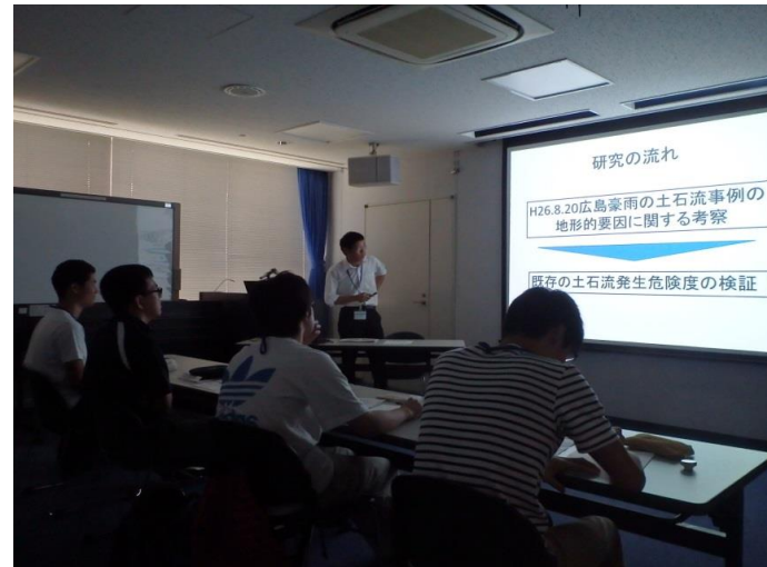
太田川河川事務所の取組 (危険度評価手法の研究事例について)