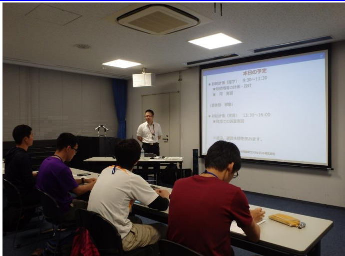
砂防堰堤設計計画(座学) 一設計の流れについて一