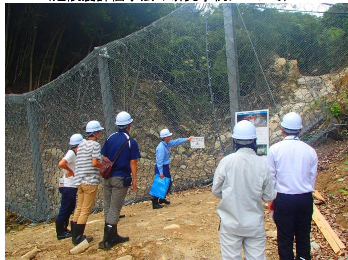
現場視察(八木地区) -8.20広島土砂災害復旧現場-