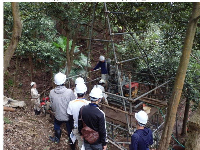
砂防堰堤設計計画(実地) 一地質調査作業見学一