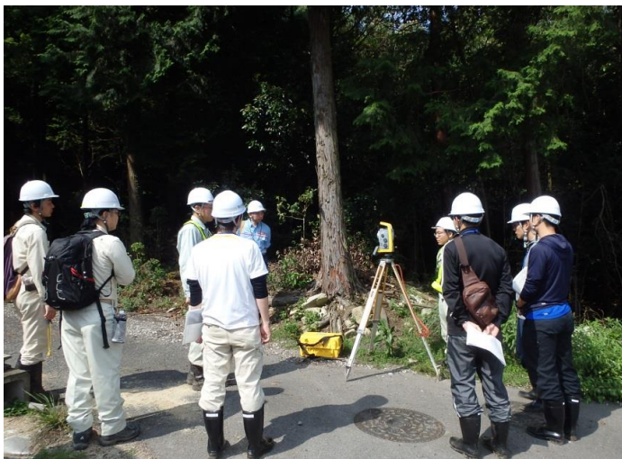
砂防堰堤設計計画(実地) 一測量作業見学一