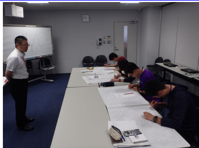
砂防堰堤設計計画(座学) 一運搬可能土砂量の計算問題一