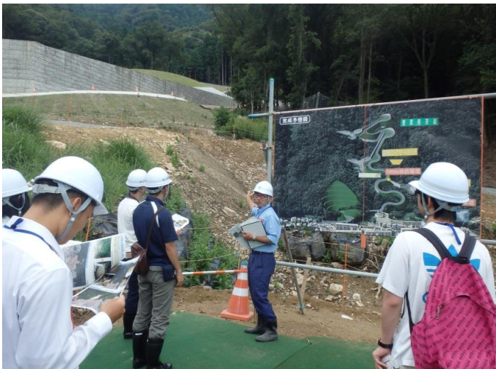
現場視察(八木地区) -8.20広島土砂災害復旧現場-