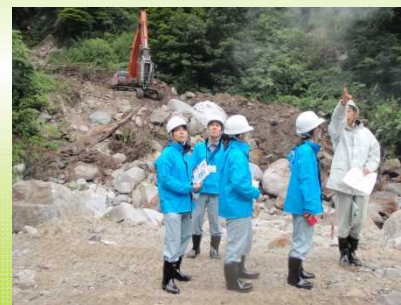
小黒部谷砂防事業見学